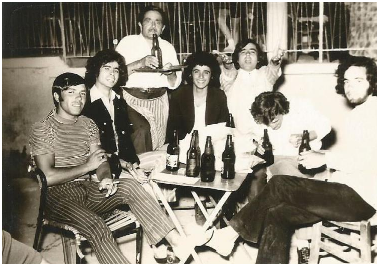
15 Αυγούστου 1972. Λαύκα Στυμφαλίας Κορινθίας

Στυμφαλία, έχω μάλιστα κάτι φωτογραφίες ωραίες εκείνης της εποχής που γλεντάγαμε εκεί στα πανηγύρια που γινόταν το καλοκαίρι και εκεί ήρθαμε πιο κοντά.