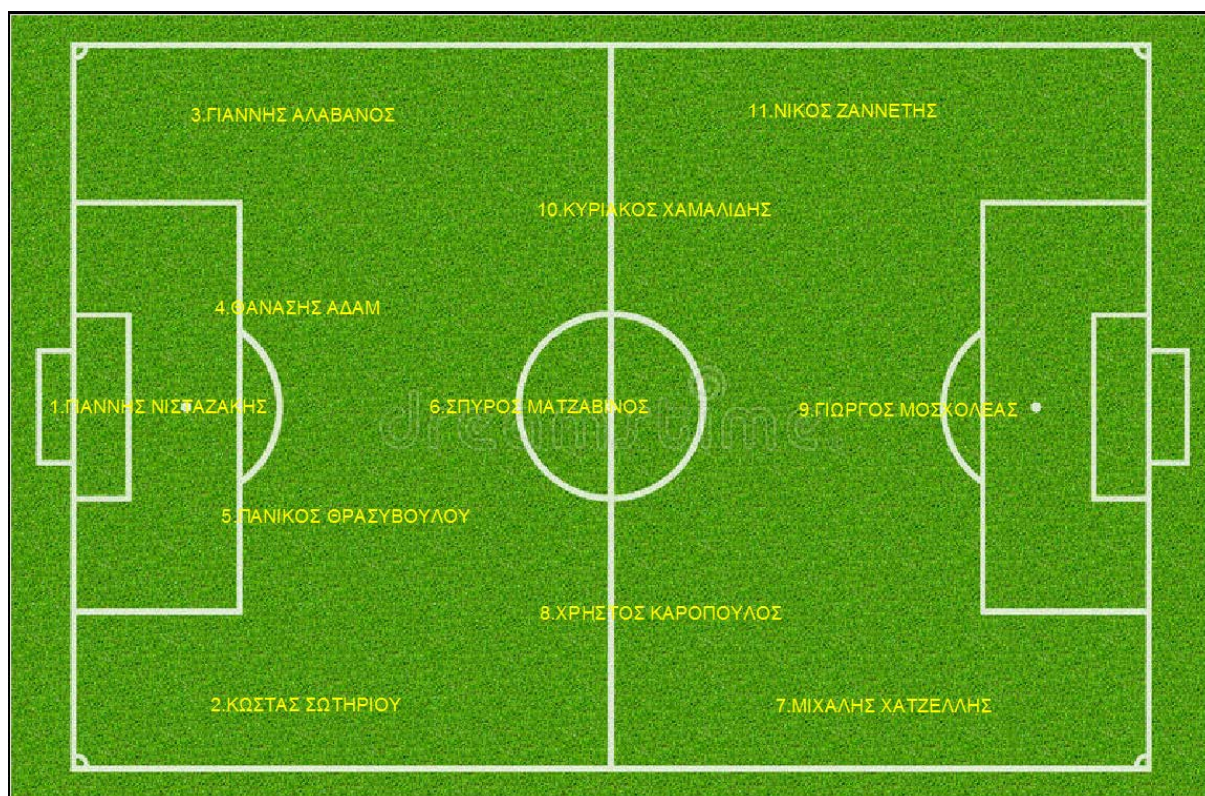
Η ποδοσφαιρική ομάδα

Τους έχω απεικονισμένους, μπορώ να στο δώσω, δηλαδή το έχω φτιάξει με τις θέσεις που έπαιζε ο καθένας. Ναι, ο Γιάννης ας πούμε έπαιζε αριστερό back.