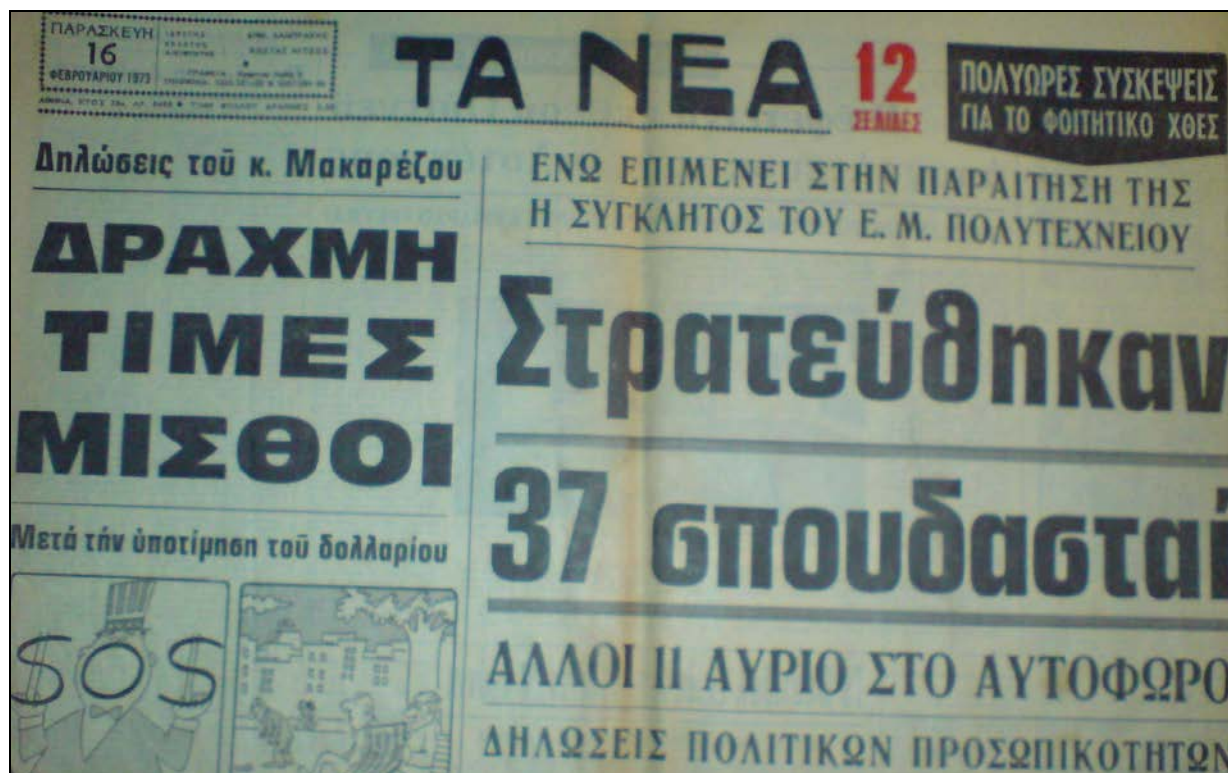
ΤΑ ΝΕΑ Παρασκευή 16-2-1973