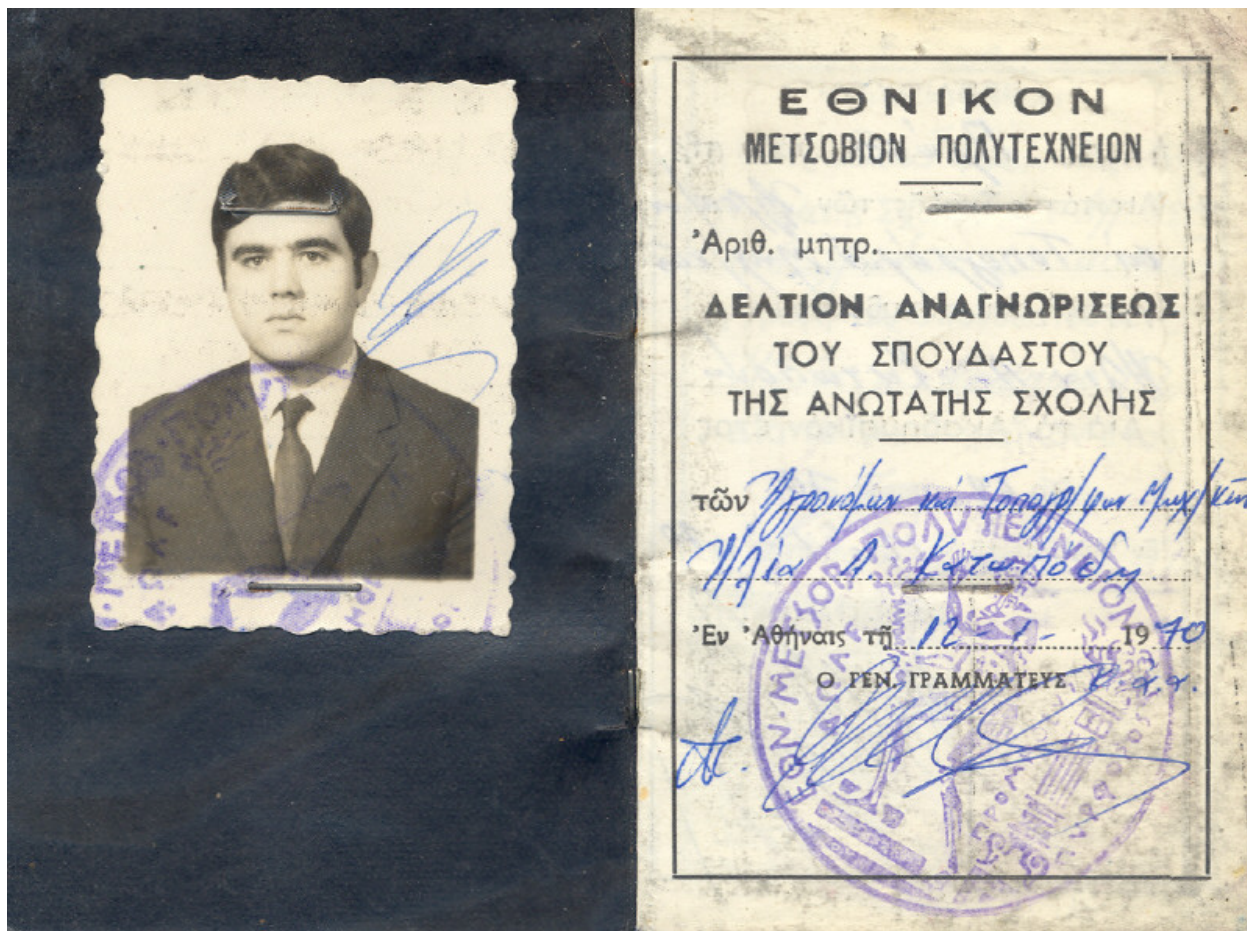
Η φοιτητική ταυτότητα